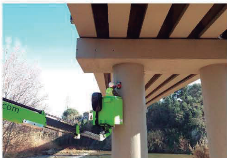
Cálculo de estructuras de obra civil