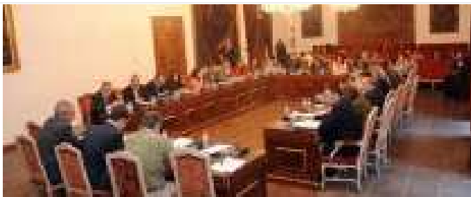
La Diputación aprueba el Plan de Inversiones para la provincia con 14 millones