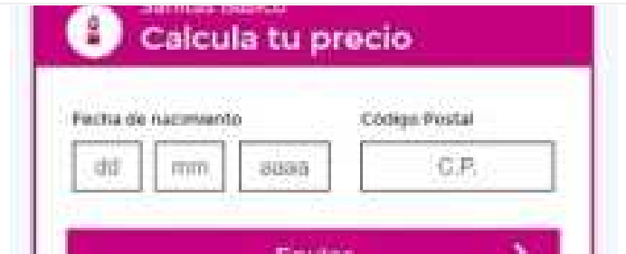
Seguro salud más barato Te calcula el mejor precio con tu fecha de nacimiento y código postal