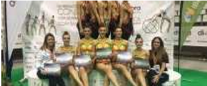
El Liceo se proclama campeón de España