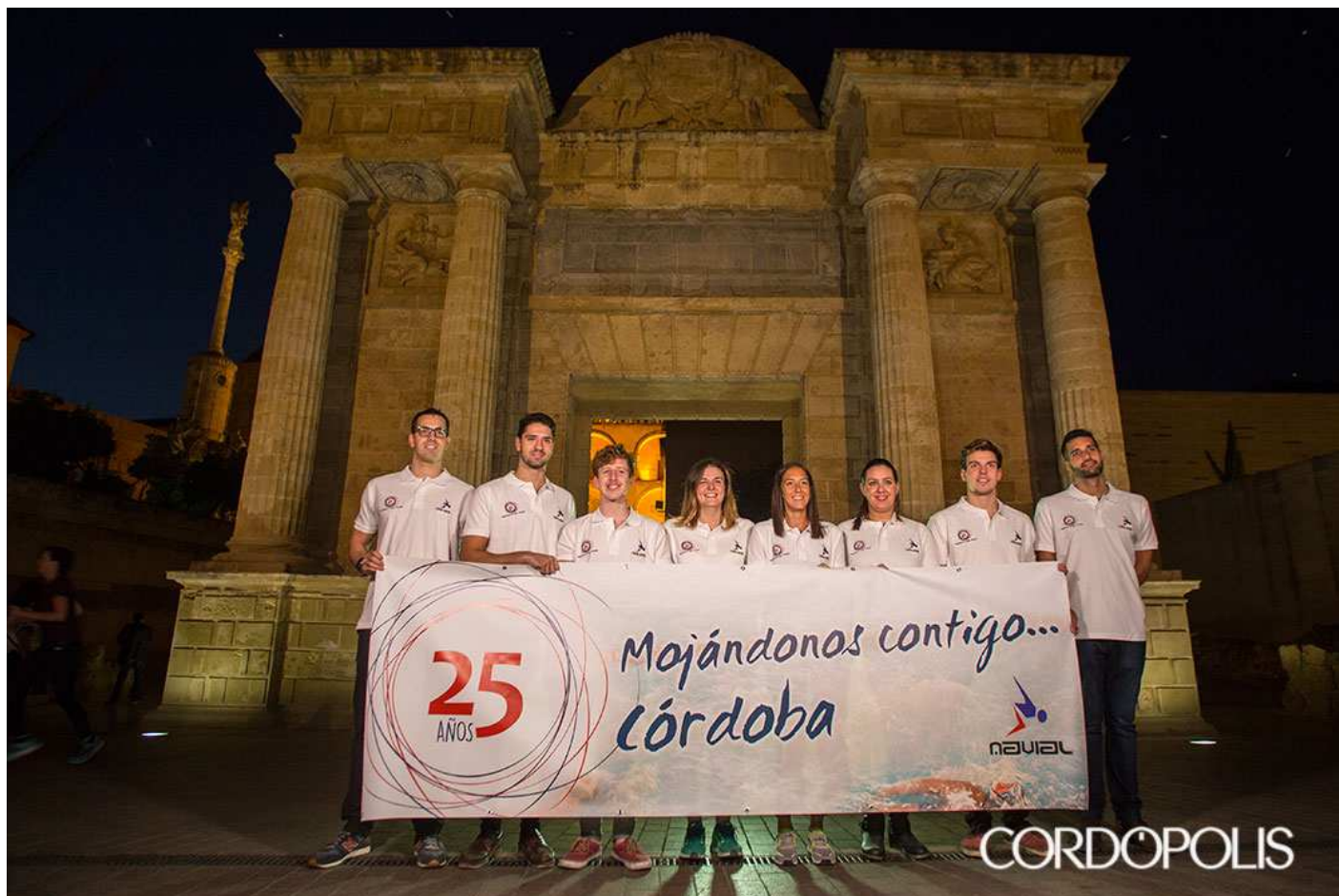
Ocho de los nueve internacionales del Naval en la Puerta del Puente

La pregunta es tan sencilla como compleja a la vez. ¿Qué es Naval? De entrada, con la respuesta en su modelo simplista, es un club referente en la natación tanto andaluza como nacional. Pero nada es tan fácil, ni tan poco en este caso. La entidad cordobesa es una gran familia, una escuela de valores, un motivo de satisfacción. La contestación más completa es ésta, y sin embargo no es la absoluta. Un cuarto de siglo después de su fundación, con deportistas de primer nivel y una cantera envidiable y admirada, el conjunto cordobés es un ejemplo a seguir. Uno de esos que en ocasiones ocupan, de manera injusta, un segundo plano en la vida diaria de una ciudad, de una región o de un país. Aunque eso no importa cuando las convicciones son inabarcables. El Naval es un círculo infinito, siempre abierto.