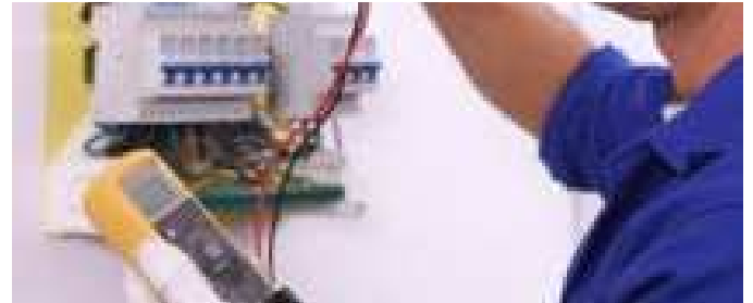
Ahorra en factura de luz Este curioso dispositivo ahorra más de un 50% en la factura de la luz