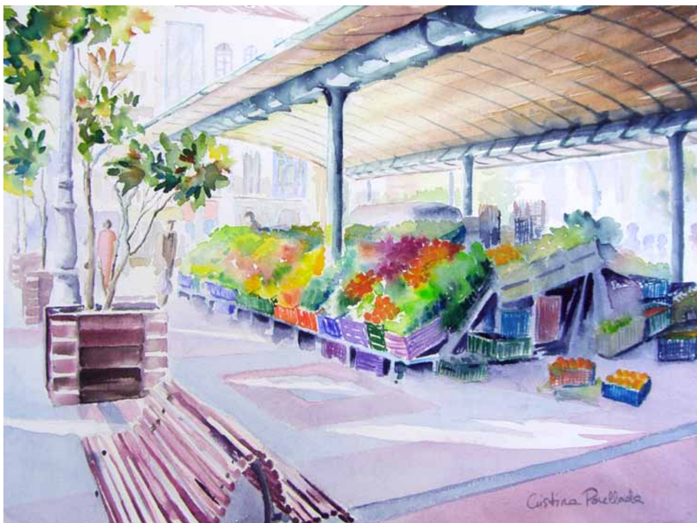
Marquesina, lunes por la mañana Plaza España, Valladolid