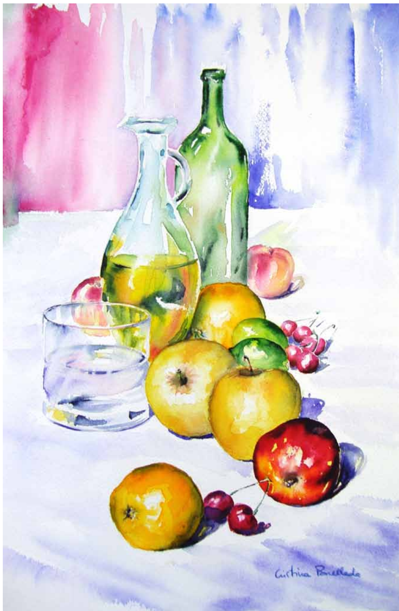
Bodegón de cristales y frutas