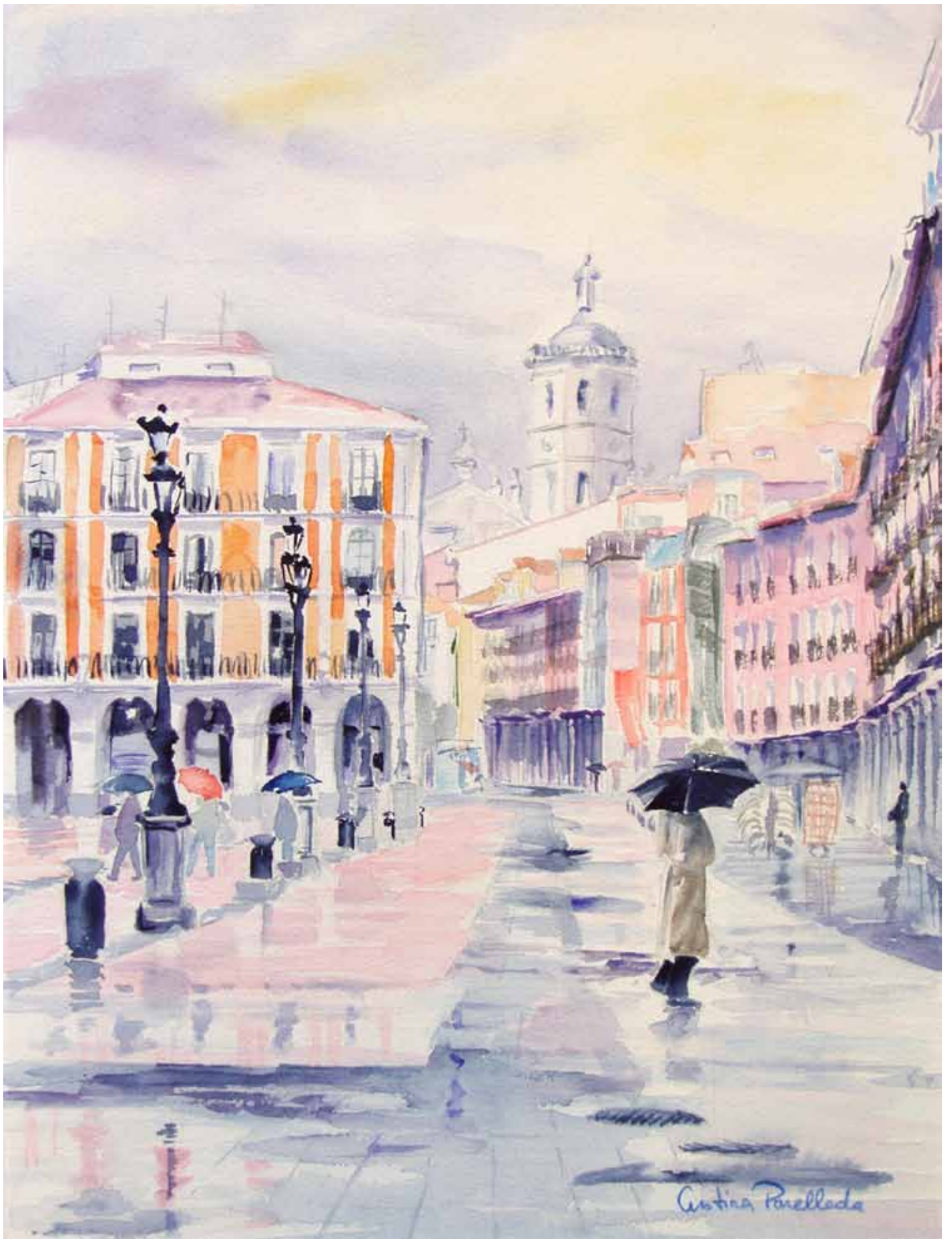
Día de lluvia Plaza Mayor, Valladolid