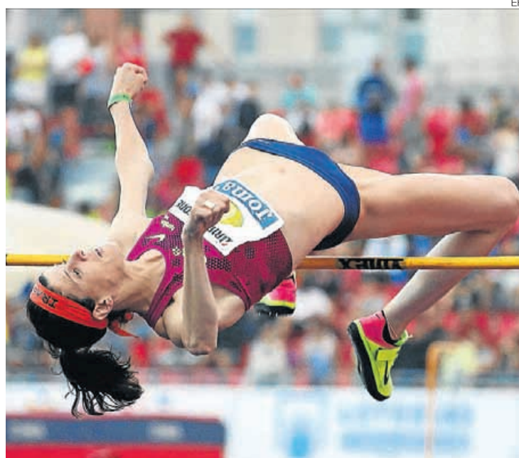
► Ruth Beitia, durante una competición.

A ellos se une el atleta de origen marroquí Adel Mechaal, quien competirá en los 1.500 después de que el Tribunal de Arbitraje Deportivo (TAS) le haya exonerado de una infracción de la normativa antidopaje tras haber sido acusado de saltarse tres controles, un hecho penalizado por la legislación deportiva. ≡