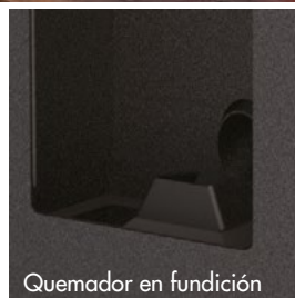
Quemador en fundición