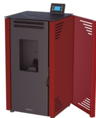
Las cámaras laterales permiten un rápido acceso a los componentes de la estufa, facilitando las labores de mantenimiento.

Incluye ventilador tangencial de 230 m³/h