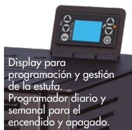
Display para programación y gestión de la estufa. Programador diario y semanal para el encendido y apagado.