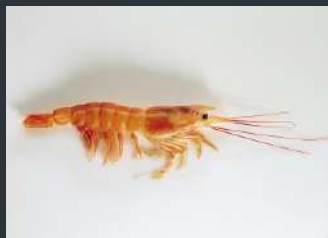
► GAMBÓN AUSTRAL 30/40 PIEZAS – 2KG 9,99€