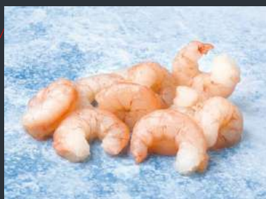
► GAMBA PELADA 10/30 piezas – 1KG 7,71€