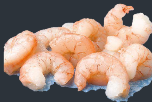
► GAMBA PELADA 30/50 piezas – 1KG 7,21€