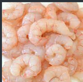
► GAMBA PELADA 70/100 piezas – 1KG 6,40€