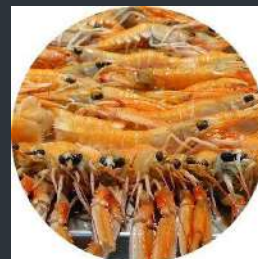
► CIGALA Nº0 9/10 PIEZAS – 1KG 26,90€